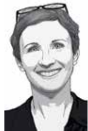
ÍRTA: FEKETE EMESE

Kling dédapa csaknem száz évvel ezelőtt megnyitott apró kovácsműhelye apáról fiúra szállva élt át háborút, szocializmust, rendszerváltást, és nőtt milliárdos forgalmú vállalkozássá, a legismertebb magyar garázskapu-nagyhatalommá. Most a negyedik generáció, egy egykori profi vízilabdázó és egy Angliából hazatelepült Forma-1-es tervezőmérnök készülnek rá, hogy ne csak átvegyék az irányítást, hanem dobjanak is valami nagyot.